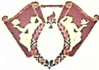
경희사이버대학교 KYUNGHEE CYBER UNIVERSITY

El Memorando de Entendimiento (MOU) se mantendrá vigente por un período de tres años a partir de la fecha en que sea firmado por los funcionarios correspondientes de las dos universidades. Se renovará automáticamente por otros tres (3) años a menos que cualquiera de las partes notifique por escrito a la otra parte su deseo de terminar o revisar este MOU seis meses antes de la terminación del período de tres años dado.