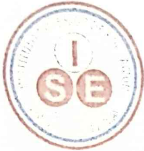
Instituto Superior de Educación "Dr. Raúl Peña" Ley N° 1692/01

KYUNG HEE CYBER UNIVERSITY, REPÚBLICA DE COREA